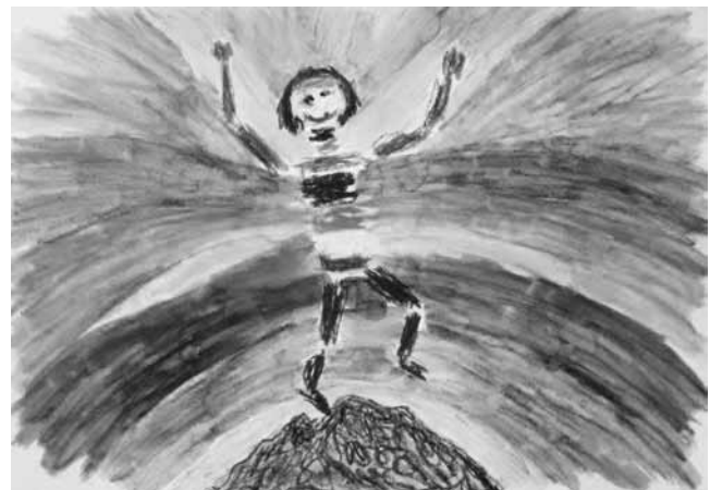
Abb. 4: Lebendigkeit-Verbundenheit

Nach den biografischen Bearbeitungen malt sich Fr. E. offen, bezogen und verbunden mit der Welt (vgl. Abb. 4), ausgedrückt durch die Farben, die sie von der Welt her wieder erreichen, durch sie hindurch und aus ihr heraus, ins Fließen gekommen sind. Die „somatischen“ Beschwerden sind abgeklungen und in der Körperwahrnehmung fühlt