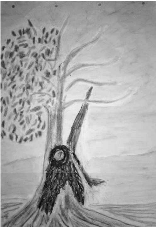
Abb. 1: Imagination: Baum

Themen der Therapie mit Fr.E. eingegangen, sondern es wird hauptsächlich die phänomenologische Arbeit mit inneren Bildern fokussiert, die sowohl das „psychische“ als auch das „somatische“ Erleben von Fr.E. in ihr Bewusstsein heben konnte und so einer Veränderung zugänglich wurde. Fr. E. braucht zu Beginn der Therapie v.a. einen guten Raum für ihr Erleben, für ihre Eigenart und Einzigartigkeit. Nach und nach fasst sie Vertrauen und kann sich auf einen inneren Dialog mit sich einlassen. Neben der Ermutigung durch die Therapeutin und der neuen, positiven Beziehungserfahrung, in der sie mit ihrem Erleben im Mittelpunkt des Interesses steht, ist es für den Zugang zu ihr selbst hilfreich, einen Baum zu imaginieren (vgl. Abb. 1.) (Reddemann 2001).