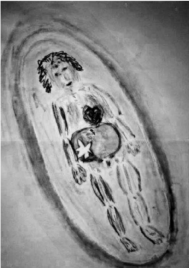
Abb. 2: Body scan

Fr.E.: „Irgendetwas Gewaltiges....Ich sehe jetzt ein kleines Mädchen am Rand des Loches.“